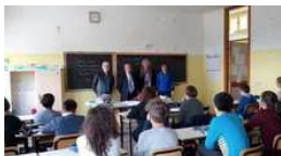
Marche, ok della prima commissione alla programmazione scolastica