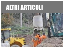
Marche, l'Anas porterà a termine le attività della Quadrilatero