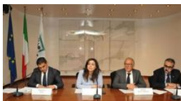
Accordo Mps-Confindustria 200 milioni per il "reshoring"