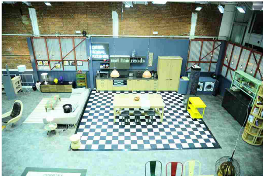
La cucina Diesel Social Kitchen di Scavolini scelta per il programma Hell's Kitchen Italia

concorrenti con piatti all'insegna della cucina gourmet, internazionale ed etnica, che affiancano i grandi "classici" di Hell's Kitchen.