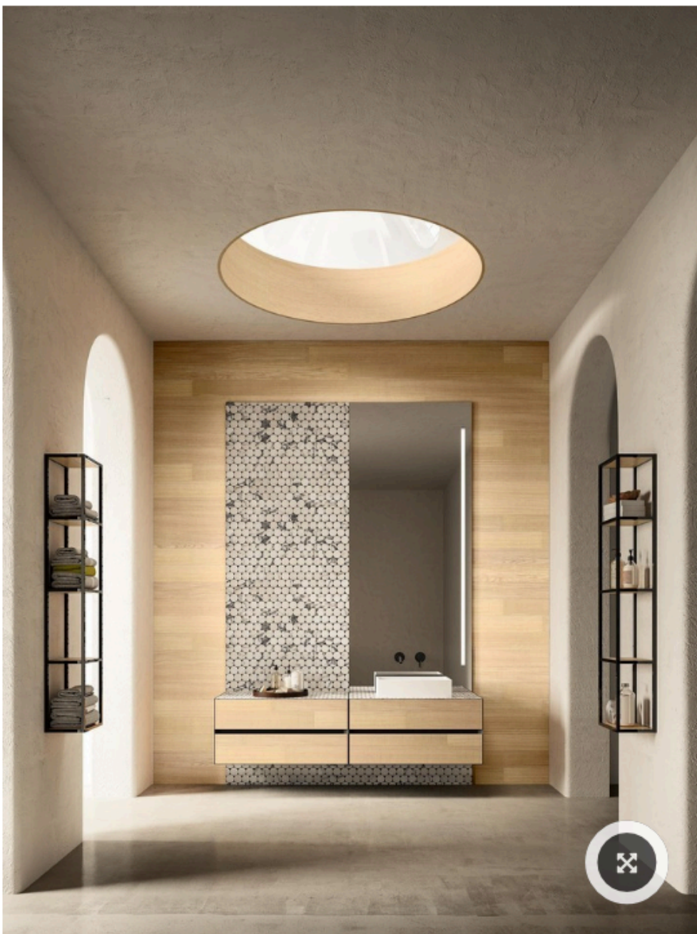
Línea combina madera natural y mármol de Carrara.

Fueron 200 las empresas internacionales de diseño que presentaron sus máximas novedades. Firmas italianas, alemanas y españolas, entre otras, coinciden en lo importancia de crear dentro de un baño una experiencia relajante, única y placentera . Referentes de la industria recurrieron a diversas alternativas para crear una atmósfera singular.