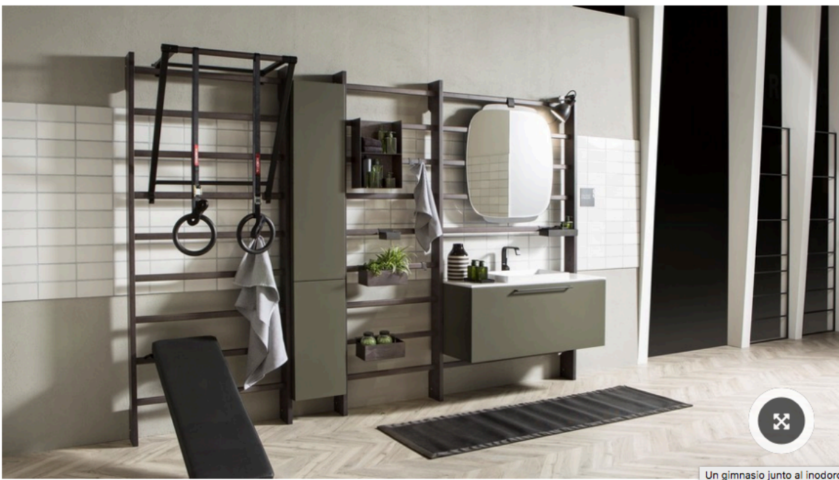
Una de las propuestas más innovadoras fue la sala que combina el baño con un gimnasio.

200 empresas se reunieron en Milán para mostrar sus últimas novedades.