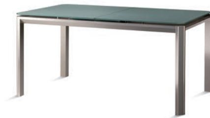
Tavolo chiuso Non extended table Table fermée Tisch geschlossen Mesa cerrada