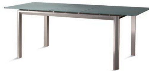
Tavolo allungato Extended table Table allongée Tisch ausgezogen Mesa extendida

Il tavolo Ice ha struttura e gambe in Alluminio finitura Acciaio con inserto in vetro temperato incollato sulle gambe. Il piano, allungabile, è in vetro temperato serigrafato e acidato.